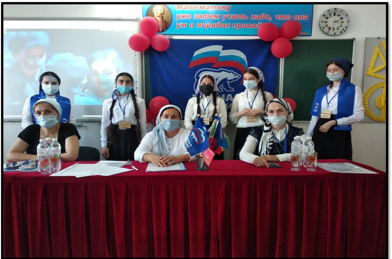
Зам. директора ВР: