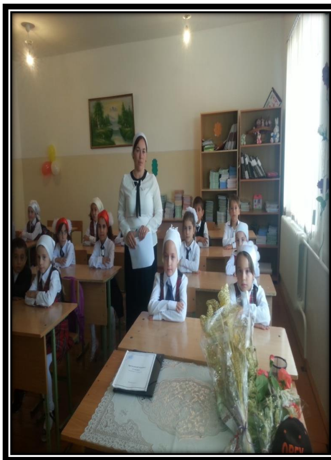
3 сентября в МБОУ «Верхне-Нойберская СШ №1» были проведены классные часы и общешкольная линейка 15-й годовщине теракта в г. Беслан.