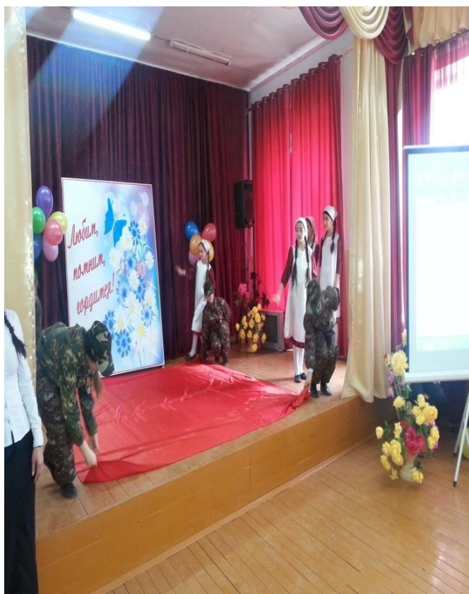
Была проведена встреча с родственниками ВОВ и воинами-интернационалистами.