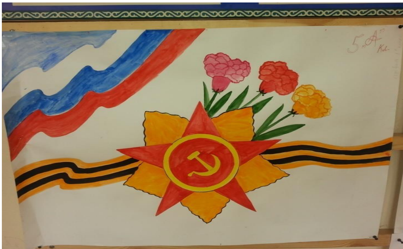
Был проведен конкурс рисунков и стенгазет «Защитники Отечества» учителем ИЗО Бисултановой М.М., Ибрагимовой М.М. и Тухашевой С.В.