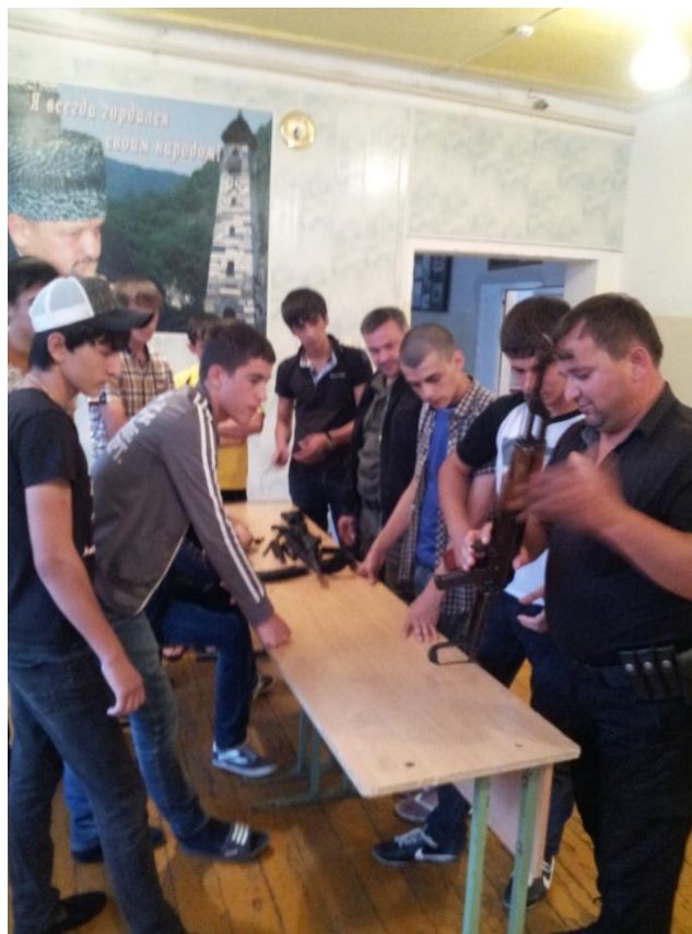
И завершили месячник посвященный гражданско-патриотическому воспитанию учащихся общешкольным торжественным мероприятием.