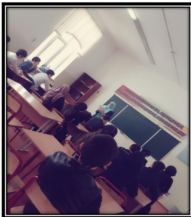
Круглые столы по вопросам толерантности в молодежной среде.