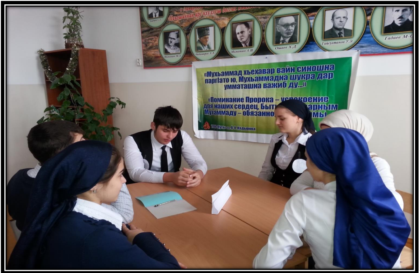
Уроки истории и обществознания на тему: «День гражданского согласия и единения».